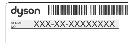
Immagine a scopo puramente illustrativo.

Il numero di serie si trova nell'angolo inferiore destro della contropiastra, sul modulo di registrazione all'interno della confezione e sul grande adesivo informativo presente intorno al rubinetto una volta disimballata l'unità.